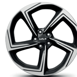
21" lichtmetalen velgen met 255/40 R21 banden