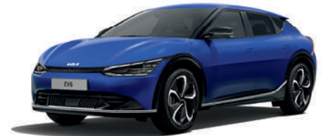
Yacht Blue (DU3)*