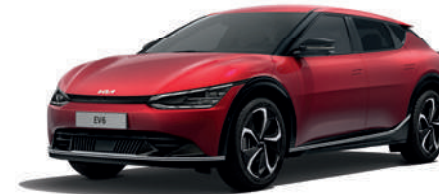
Runway Red (CR5)