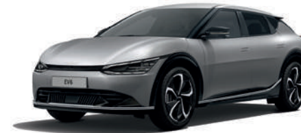
Moonscape (Matte) (KLM)