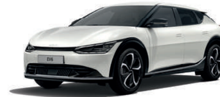
Snow White Pearl (SWP)