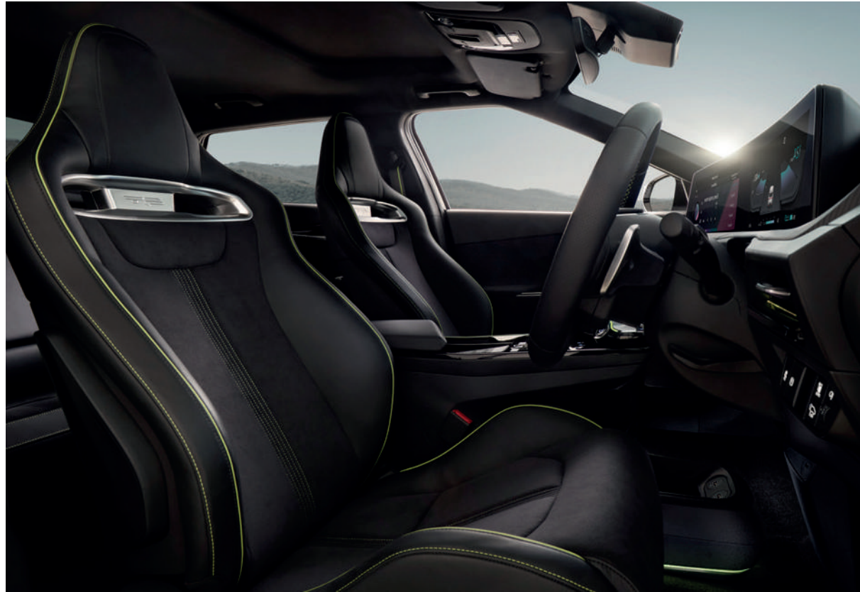
Zwart Sport suede en vegan leder zetels