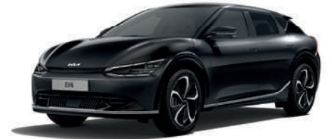
Aurora Black Pearl (ABP)