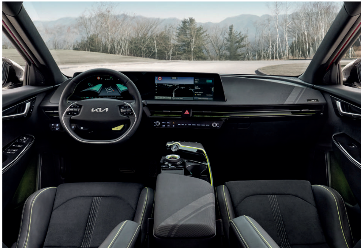
Certaines informations sont communiquées à titre indicatif et sont sujettes à modification en attendant l'homologation de cette version.