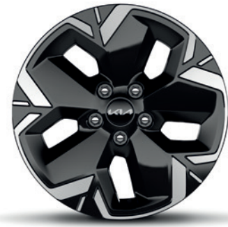
Jantes en alliage 17" et pneus 215/55 R17 17" lichtmetalen velgen met 215/55 R17 banden