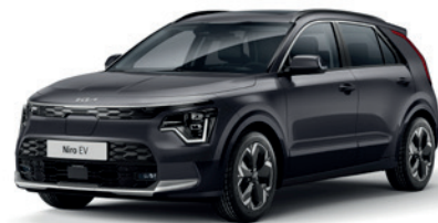
Interstellar Grey (AGT)** (Disponible en option sur Pace avec montant arrière noir) (Met zwarte achterstijl - beschikbaar als optie op Pace)