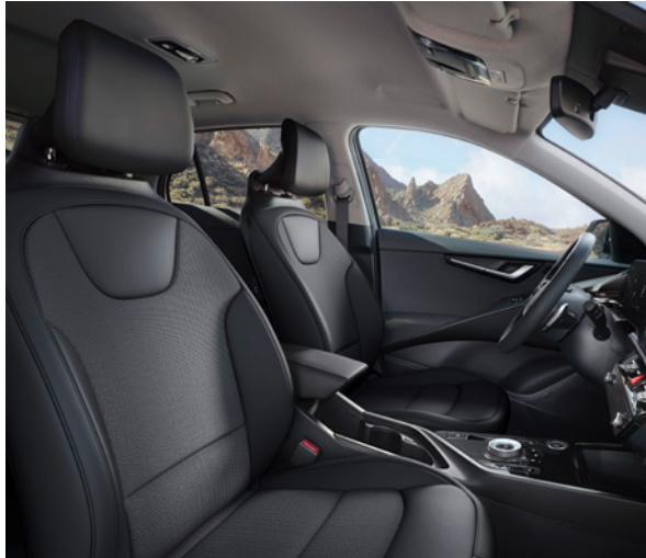
Tissu/Cuir artificiel - Noir (de série sur Pure et Pulse) Stof/Kunstleder - Zwart (standaard op Pure en Pulse)