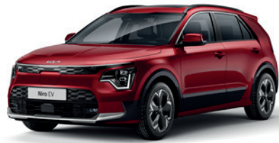
Runway Red (CR5)** (Disponible en option sur Pace avec montant arrière noir) (Met zwarte achterstijl - beschikbaar als optie op Pace)