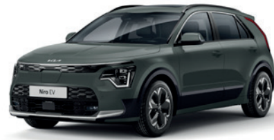
Cityscape Green (CGE)** (Disponible en option sur Pace avec montant arrière noir) (Met zwarte achterstijl - beschikbaar als optie op Pace)