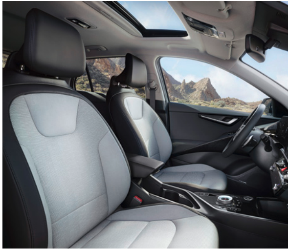
Cuir artificiel - Gris (de série sur Pace) Kunstleder - Grijs (standaard op Pace)