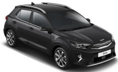
Aurora Black Pearl _ ABP