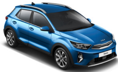
Sporty Blue _ SBP