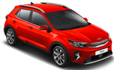
Signal Red _ BEG