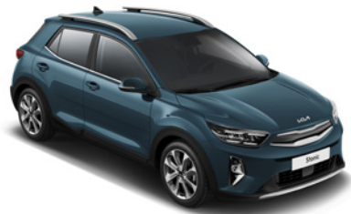
Smoke Blue _ EU3