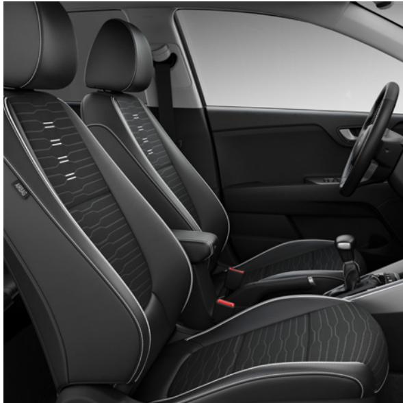
Tissu & Cuir Artificiel - Noir (de série sur GT Line) Stof & Kunstleder - Zwart (standaard op GT Line)