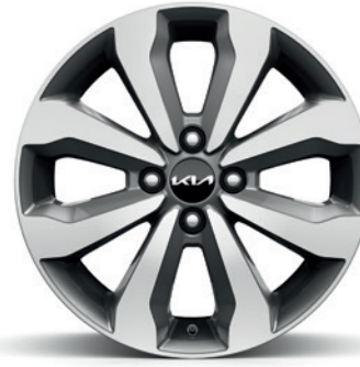
Jantes en alliage 16" avec pneus 195/55 (de série sur Pure et Pulse) 16" lichtmetalen velgen met 195/55 banden (standaard op Pure en Pulse)