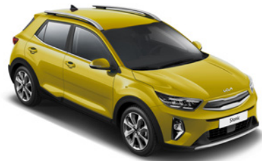
Honeybee _ B2Y