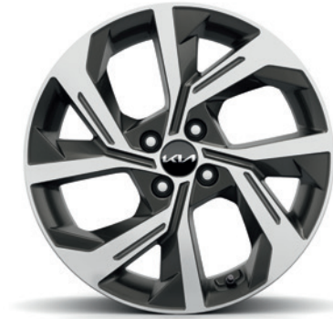
Jantes en alliage 17" avec pneus 205/55 (de série sur GT Line) 17" lichtmetalen velgen met 205/55 banden (standaard op GT Line)