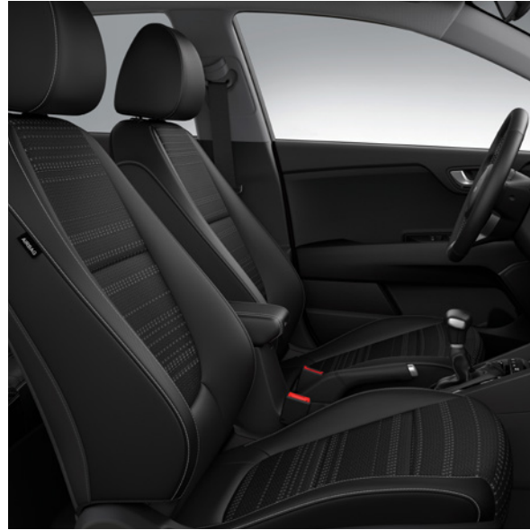
Tissu - Noir (de série sur Pulse) Stof - Zwart (standaard op Pulse)