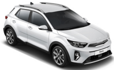
Clear White _ UD*