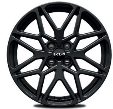
Jantes en alliage 17" avec pneus 205/55 (Pack Design sur Pulse) 17" lichtmetalen velgen met 205/55 banden (Design Pack op Pulse)