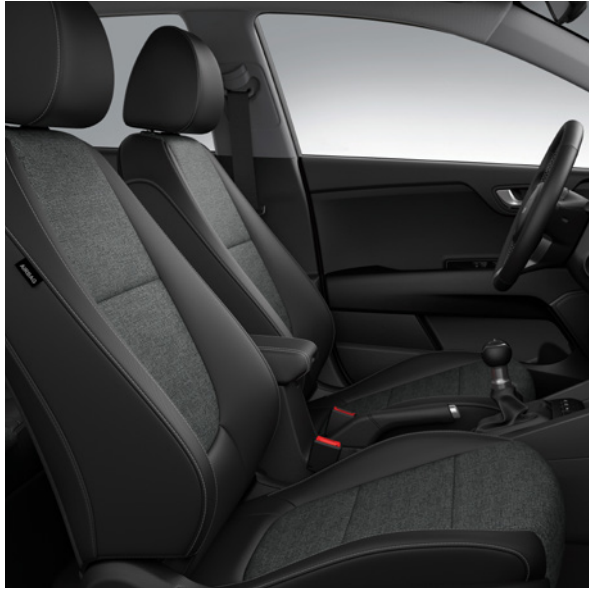
Tissu - Noir (de série sur Pure) Stof - Zwart (standaard op Pure)